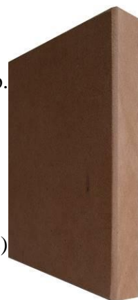
MDF-plade, 19 mm