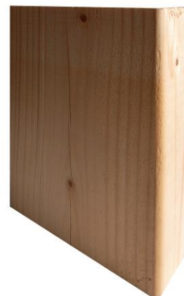
Træplade, 4 cm